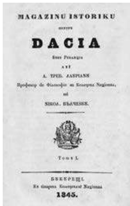
Magazin istoric pentru Dacia, sub redacția lui August Treboniu Laurian și Nicolae Bălcescu, 1845.

A doua mare sfidare a secolului al XIX-lea a fost problema modernizării , în fapt a occidentalizării societății românești. Renunțarea la orientalismul și tradiționalismul scrisului și vestimentației însemna, fără îndoială, o apropiere de modelul occidental, dar greu rămânea de făcut. Întrebarea era cum puteau fi puse în mișcare un sistem patriarhal și autoritar, o societate covârșitor rurală, dominată de marea proprietate și aproape lipsită de fermentii moderni ai capitalismului și democrației. Într-un interval scurt, și cu deosebire în deceniul 1860–1870, tânăru stat român a